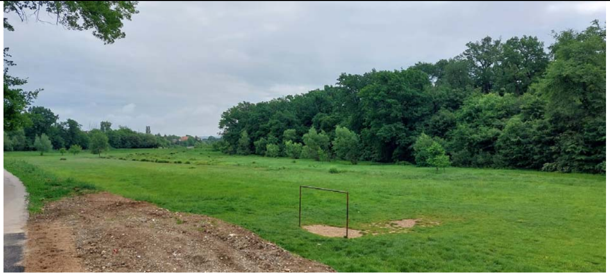
Vedere #3, din coltul de S-V ( Strada Ludos, colt cu strada Pictor Theodor Aman). In prin plan se poate vedea poarta de fotbal existenta.