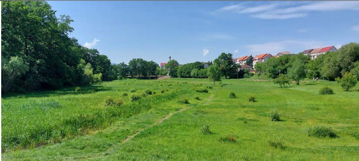
Vedere #2 de pe dig. O poteca este vizibila, facuta de cei ce se plimba prin zona.