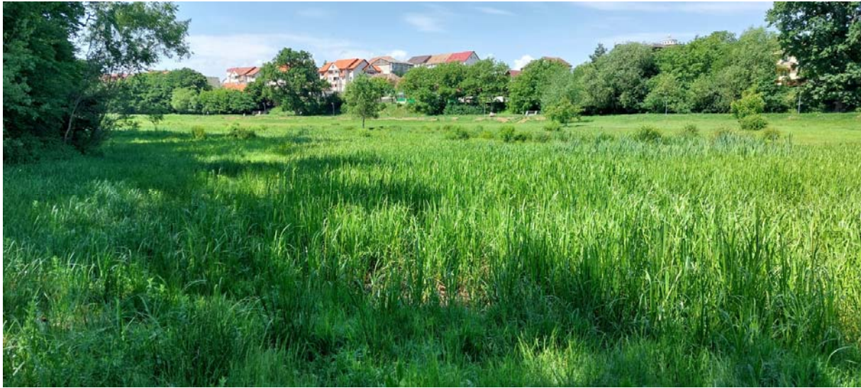
Vedere #1 de pe dig. In prim plan zone semi-umeda/mlastinoasa

Poze cu starea actuala a acestei zone si cu o parte din plantele care cresc in mod natural.