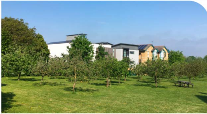
Midsummer Community Orchard

Exemplu de livada cu pomi fructiferi din Anglia.